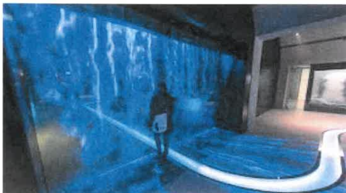
Hydropolis - replika batyskafu

Warunkiem wyjazdu jest ..... zabranie ze sobą humoru świątecznego 😊😊